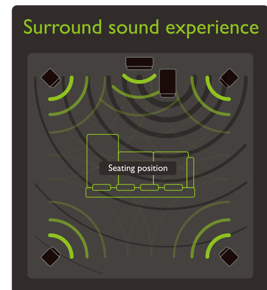
► 5.1 channel system setup

To check if PRO-LOGIC is enabled, press the button on the remote or subwoofer. The display will show PL.ON when the function is activated.