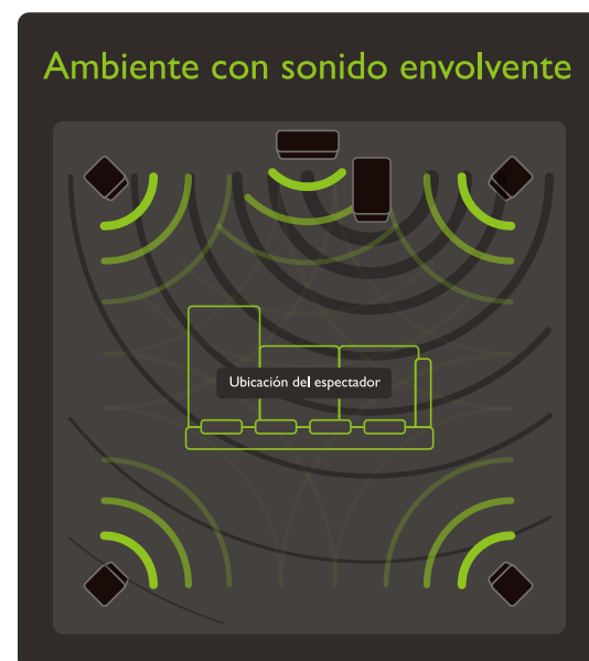
► Configuración del sistema de parlantes de 5.1 canales

Nota: La función PRO-LOGIC debe estar habilitada ( ON ) para experimentar la configuración de 5.1 canales. Para comprobar si PRO-LOGIC está activada, oprima el botón en el control remoto o en el parlante de graves. Cuando PL.ON se ilumine en la pantalla, significa que la función está activada.